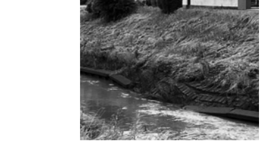
↑改修が急がれる釣川の護岸の様子