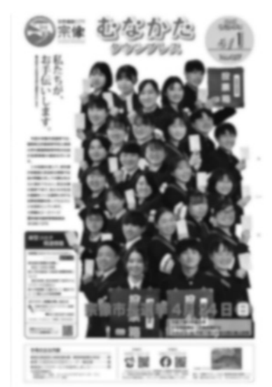
↑むなかたタウンプレスより

2021年3月議会一般質問において、市役所やコミュニティ・センター等の公共施設で、行政やまちづくりに興味のある高校生や大学生などの若者をインターンとして受け入れる事で、学生のスキルアップ、本市への就職希望のきっかけづくり、職員など関わった大人の活性化が期待できると思い提案をしていました。（宗像市のワクワクWORKの高校生、大学生版というイメージです）当時宗像市では「インターンを受け入れてほしい」という依頼があった場合にのみ受け入れるかどうかを判断している状況でしたので、『 市の方から市内の高校生大学生に呼びかけてはどうか？ 』と問いました。※宗像市議会録画配信でご覧いただけます 執行部からは『 地域の若者を受け入れるということが育成という観点での地域貢献であると捉え市内の高校、大学へ呼びかける検討をします。 』との回答をいただきました。今回の宗像市の取り組みは高校生など若い有権者への選挙啓発、市民全体への選挙広報にもつながるのではないかと期待しています。機会を創っていただいた関係者のご尽力に心より感謝いたします。そしてなんと娘がこの企画に応募していたことを知りました。自ら申し込み面接も受け、広報誌の表紙にも載っていました！率直に嬉しいです。