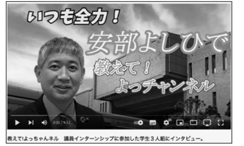
教えてよっちゃんネル 議員インターンシップに参加した学生3人組にインタビュー。